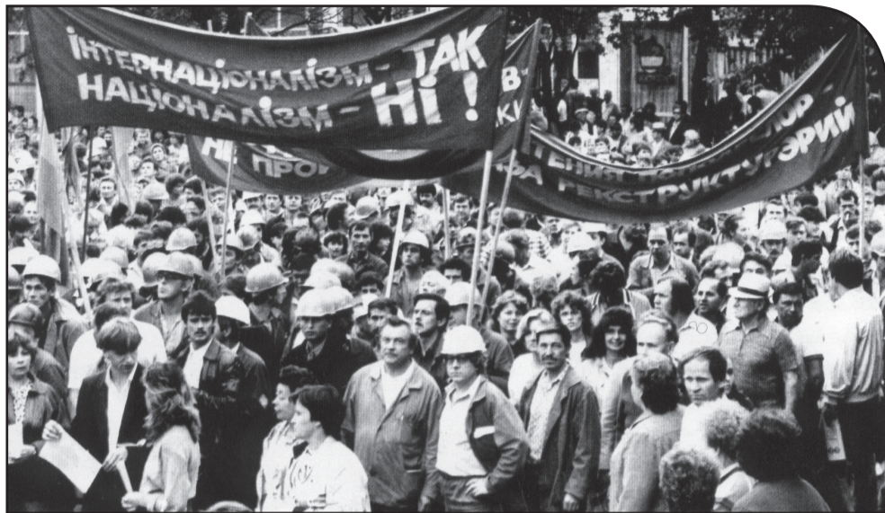
Забастовка в г. Рыбница